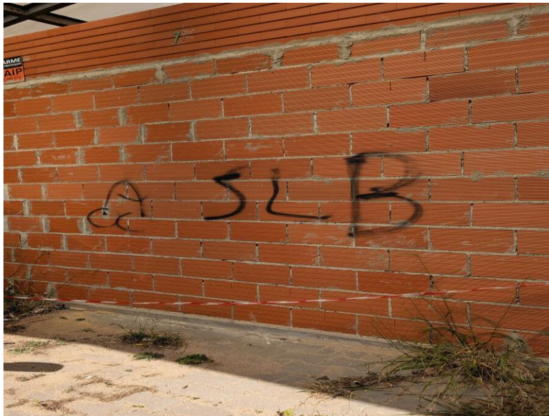
Figura 1 – Edifício do Mega Craque Clube, Telheiras, Lisboa