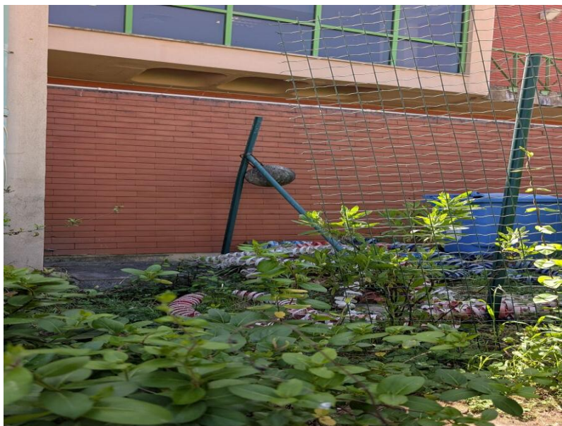
Figura 8 – Edifício do Mega Craque Clube, Telheiras, Lisboa