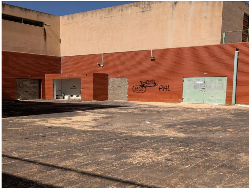
Figura 4 – Edifício do Mega Craque Clube, Telheiras, Lisboa

Representação IL na Assembleia de Freguesia do Lumiar, Lisboa E-mail: