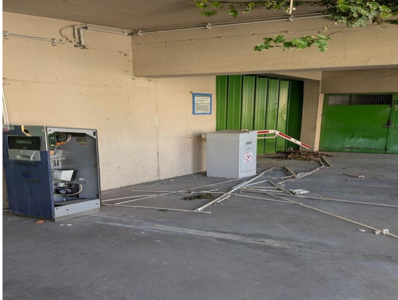
Figura 7 – Edifício do Mega Craque Clube, Telheiras, Lisboa