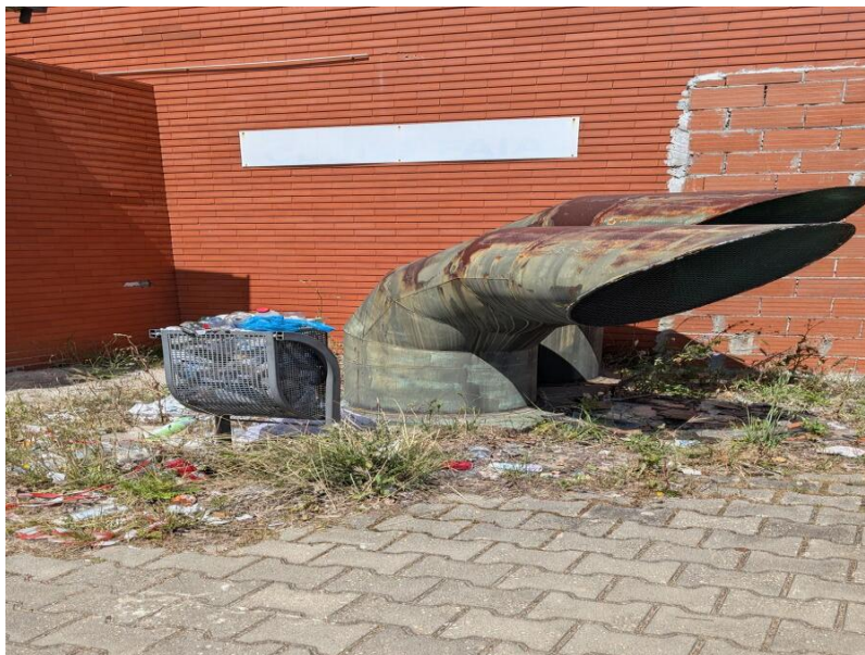
Figura 2 – Edifício do Mega Craque Clube, Telheiras, Lisboa

Representação IL na Assembleia de Freguesia do Lumiar, Lisboa E-mail: