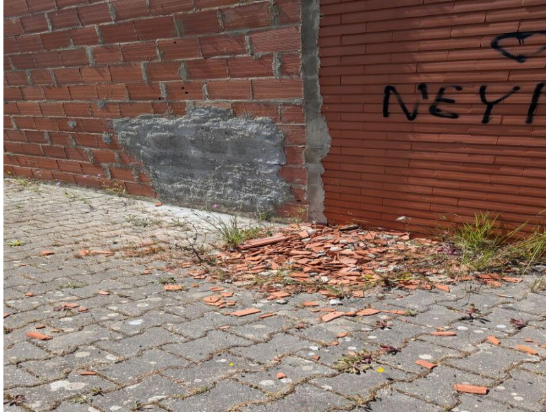
Figura 3 – Edifício do Mega Craque Clube, Telheiras, Lisboa