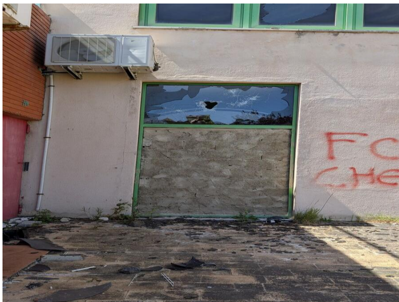
Figura 5 – Edifício do Mega Craque Clube, Telheiras, Lisboa