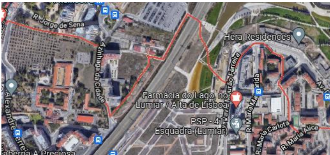
Figura 1: Atuais limites da parte norte da freguesia do Lumiar nos quais é possível constatar que o Eixo Norte-Sul serve de fronteira entre as freguesias do Lumiar e de Santa Clara