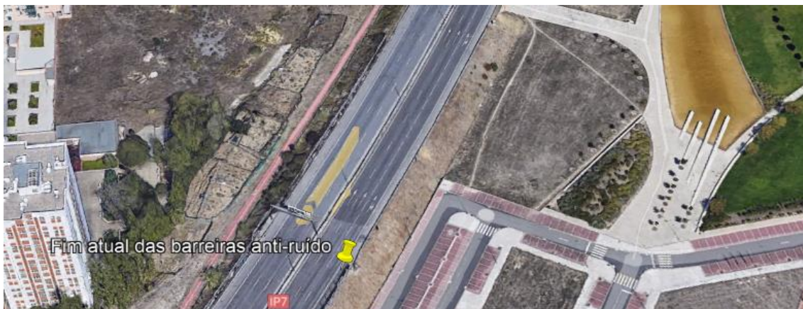
Figura 2: Representação do local onde atualmente terminam as barreiras de proteção sonora.