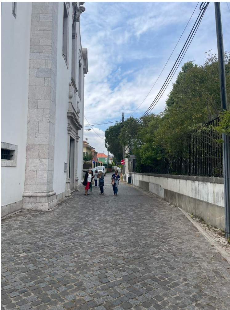
Estrada de telheiras sentido Campo Grande - Telheiras

Esta proibição também não afeta a passagem de viaturas de emergência e o transporte do lixo pode continuar a ser feito com as carrinhas a deslocarem-se em marcha-atrás.