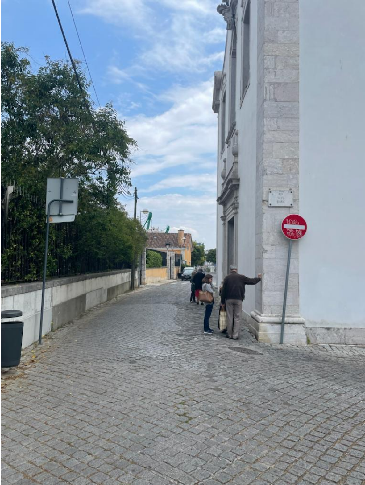
Estrada de telheiras sentido Telheiras - Campo Grande

Grupo do Partido Social Democrata Assembleia de Freguesia do Lumiar