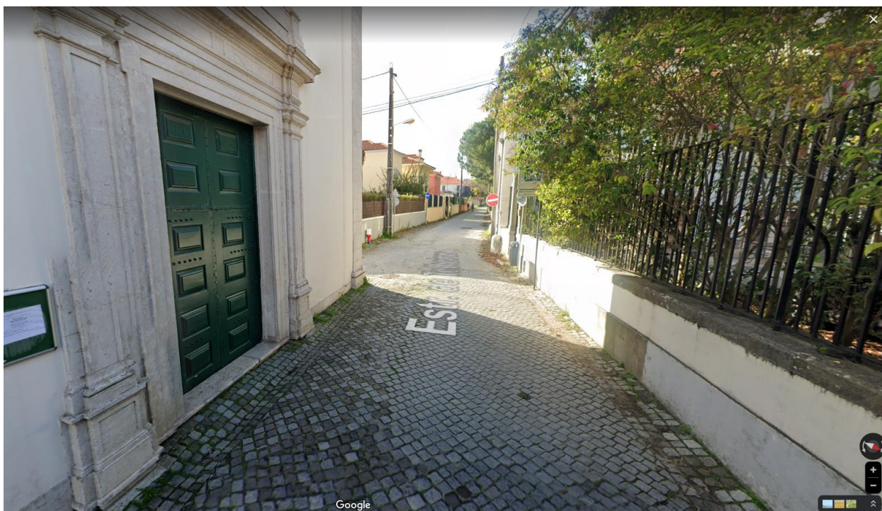
Estrada de telheiras sentido Campo Grande – Telheiras.