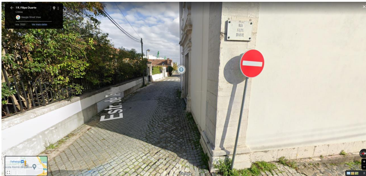
Estrada de telheiras sentido Telheiras - Campo Grande.